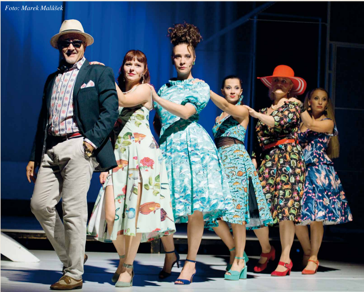
Inscenace Poprask na laguně.