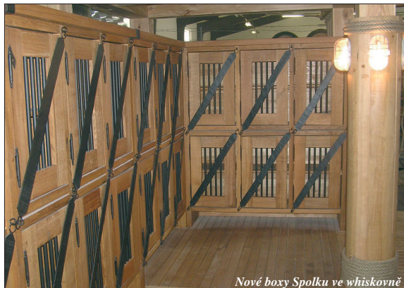
Nové boxy Spolku ve whiskovně

Chystané rozšíření Distillery Landu o expozici whisky s sebou přinese nové prostory pro archivní boxy členů Spolku přátel Jelínkovy slivovice. V současné době jsou boxy před dokončením a čekají na nové majitele. Spolek přátel Jelínkovy slivovice má nyní 170 členů, kteří mají své boxy umístěny v prostorách egalizace, Valašského šenku ve Vizovicích a v restauraci Petřínské terasy v Praze. Tyto kapacity však v současné době již nestačí, protože zájem o členství ve Spolku je velký. Rada nových boxů měla své majitele už v době, kdy se whiskovna teprve začala budovat. I ty ostatní jistě nezustanou dlouho prázdné a budou se těšit zájmu nových spolkařů. Ti si mohou své boxy vybrat i podle čísel. Ve whiskovně budou boxy číslované od č. 105 nahoru. Nových boxů je přes dvě stě, takže se na všechny určitě dostane.