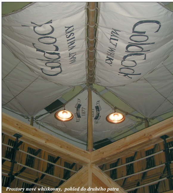
Prostory nové whiskovny, pohled do druhého patra

V úvodníku minulého čísla Trnkovin jsem se zmiňoval o jednom z připravovaných projektů – o skladu zrání whisky. V současné době se tento projekt dokončuje a jak jsem slíbil, naši zákazníci již mají možnost ochutnat whisky se značkou Gold Cock, tentokrát blendovanou (míchanou) a stáčenou v naší společnosti. Pro účely zrání a scelování whisky jsme vyčlenili budovu egalizace 2, kam byla nainstalována mohutná dřevěná konstrukce, která bude evokovat vnitřek námořní lodi převážející sudy s whisky do zámoří. Návštěvníkovi se naskytne pohled na zračí sudy naskládané ve čtyřech řadách ztrácející se v šeru skladovacího prostoru. V těchto dубových, zevnitř vypálených sudech, bude dozrávat jednak whisky, kterou naše společnost získala