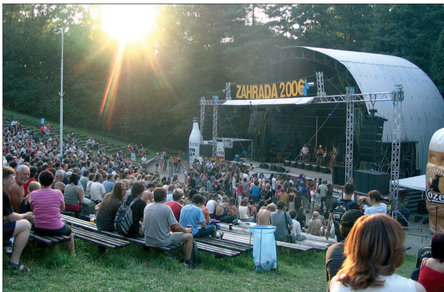
Amfiteátru v Náměstí na Haně dominovala také nafukovací láhev Plum vodky