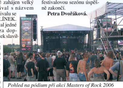
Pohled na pódium při akci Masters of Rock 2006