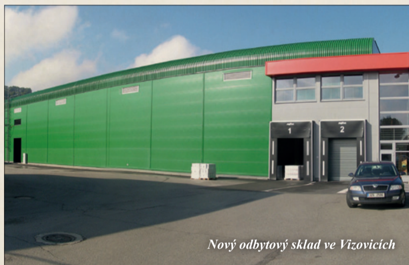
Nový odbytový sklad ve Vizovicích