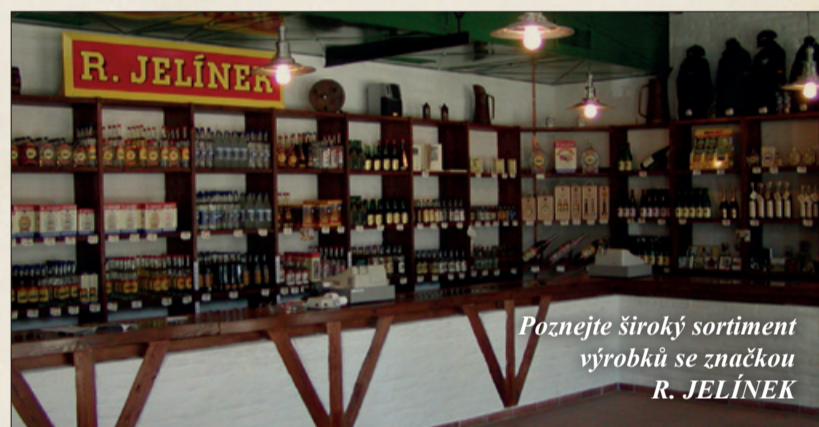
Poznejte široký sortiment výrobků se značkou R. JELÍNEK