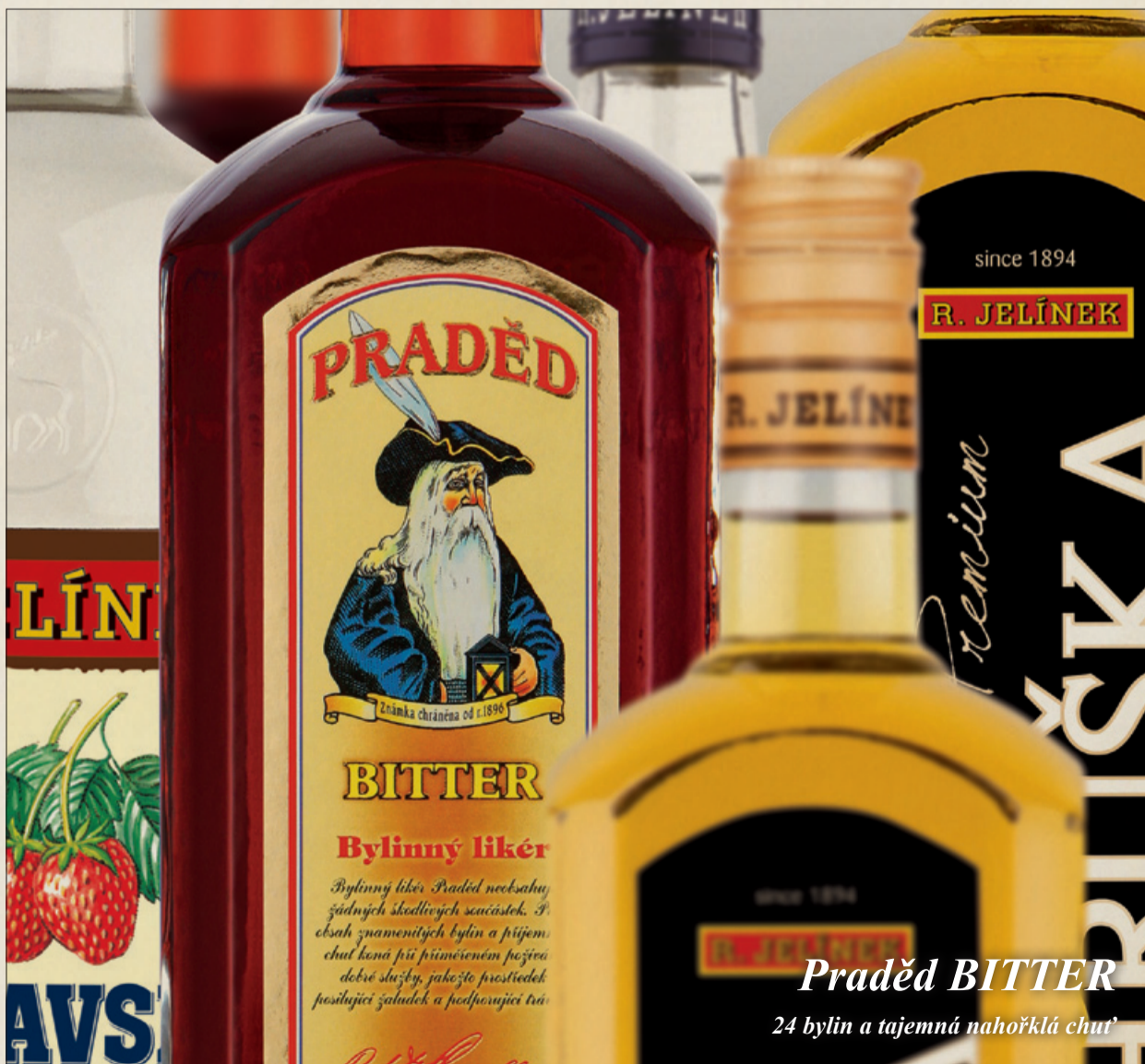
Praděd BITTER 24 bylin a tajemná nahořklá chuť