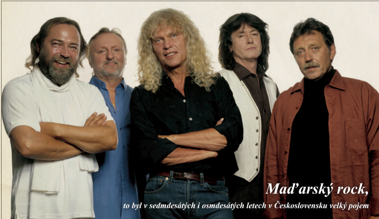
Maďarský rock, to byl v sedmdesátých i osmdesátých letech v Československu velký pojem