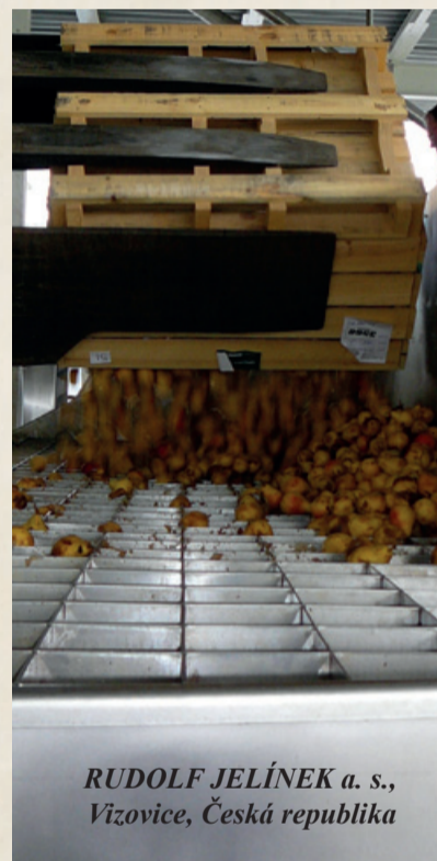
RUDOLF JELÍNEK a. s., Vizovice, Česká republika

Je pro mě až fascinující, kolik kilometrů, časových pásem, práce, telefonátů, energie, kvašení, lidského umu a konečnou hrušek je přetaveno do jedné láhve ve tvaru „budíku“ s čirým destilátem.