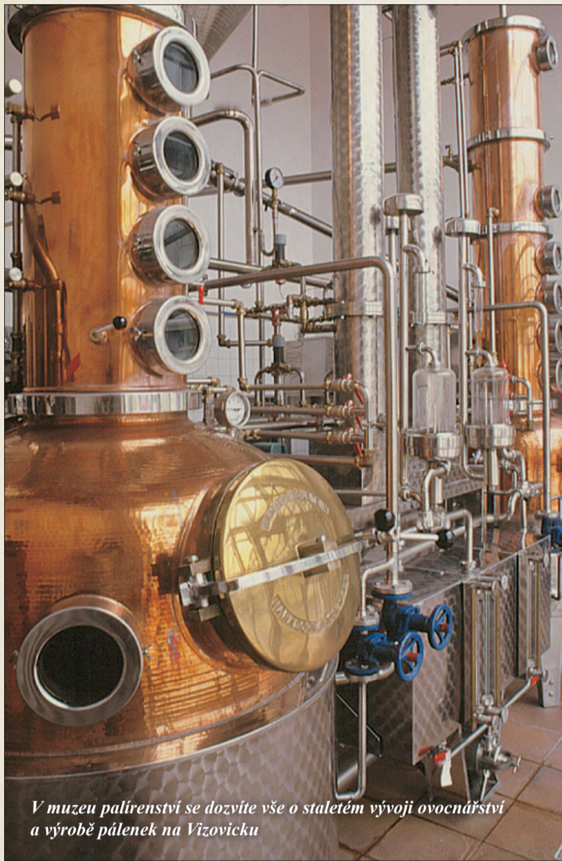
V muzeu palírenství se dozvíte vše o staletém vývoji ovocnářství a výrobě pálenek na Vizovicku