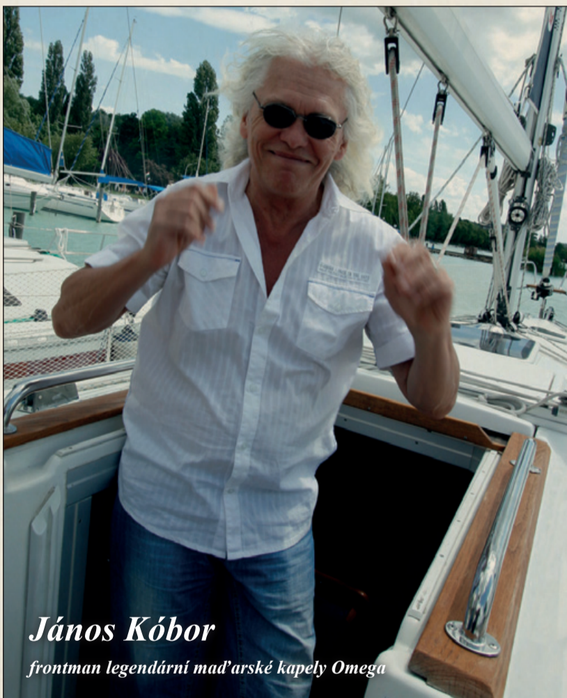
János Kóbor frontman legendární maďarské kapely Omega

To bych ani neřekl, ale líbí se mi, když si třeba polské, ruské nebo jugoslávské kapely nechají foneticky přepsat text a zpívají Dívku s perlami ve vlasech maďarsky. Je to trochu komické, ale zároveň krásné.