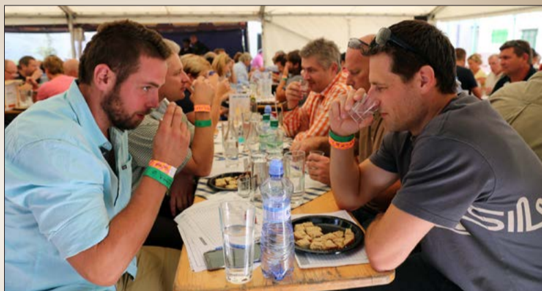
Degustace vzorků na 13. ročníku Jelínkův vizovického košťu