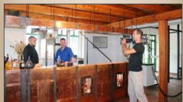
Natáčení pořadu Gondíci s.r.o.