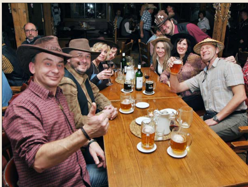
Oslava Silvestra ve westernovém duchu

Lesní penzion Bunč je svou polohou na křižovatce cest ideálním místem k návštěvě při vašich turistických cestách po Chřibech. Navštívit Bunč můžete například při předsilvestrovském výstupu na rozhlednu Brdo. Těšíme se, až se setkáme se sedmi páry, které u nás stráví nejkrásnější den svého ži-