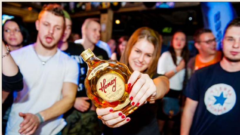
Tatranská Lomnice, klub Humno

V České republice jsme na jaře zahájili televizní kampaň na stanicích Prima Group formou klasického 30 vteřinového spotu. Ta byla podpořena i na internetu. Přímou na serverech iprima.cz a homepage seznam.cz. V průběhu roku jste naši Bohemia Honey mohli vidět jak v tištěných titulech, tak na specializovaných barmanských serverech či přímo na festivalech. Závěr roku patřil opět televizní reklamě. Tentokrát byl klasický spot na Prima Group doplněn o sponzora pořadu nebo programu na stanicích Nova Group. V gastronomických zařízeních jsou realizovány akce spojené se včelí hlídkou nebo přímo Honey party, které budou probíhat kontinuálně až do konce roku.