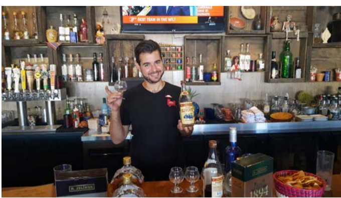
Bar v LOS ANGELES, barman z NEW YORKU