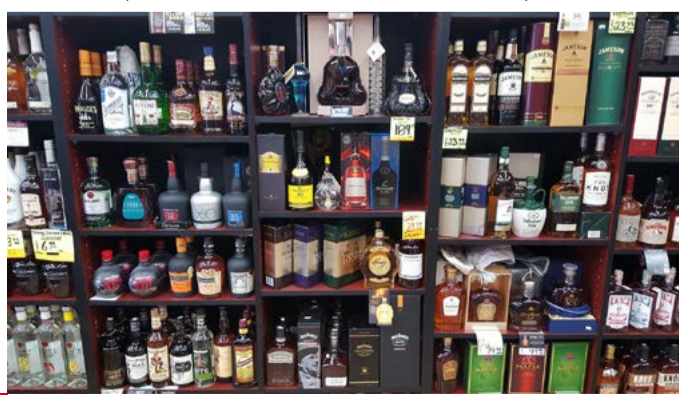
SAN DIEGO, House of Wamp