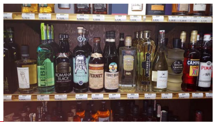
Barová scéna SAN FRANCISCO