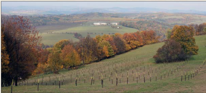
Pohled ze sadů na Janově hoře na sady na Těchlově

V pořadí již osmá sklizeň je z pohledu množství ovoce tou nejlepší. Poprvé jsme totiž překonali magickou hranici 500 tun sklizeného ovoce, přesněji to bylo 515 480 kilogramů švestek. Při pohledu zpět je ale nutné konstatovat, že v letošní sezoně byly momenty, kdy jsme měli obavy, že nesklidíme téměř nic. Připadali jsme si jako na houpačce. Začátek jara prognózoval velmi dobrou sezonu. Zlom nastal až v měsících červen a červenec, kdy jsme zaznamenali z důvodu sucha a horka větší opad plodů než obvykle a začali jsme se obávat, že úroda bude slabá. K naší velké radosti se naše obavy rozplynuly již na začátku