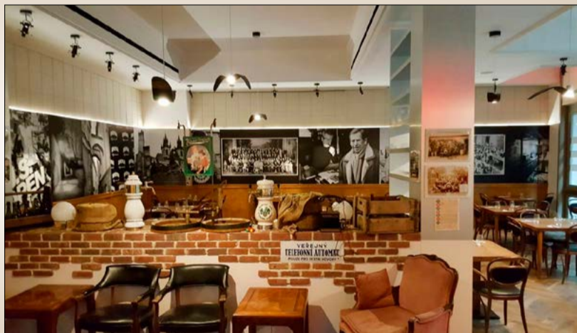
BOHEMIAN SPIRIT RESTAURANT na Manhattanu v New Yorku, kde najdete v nabídce snad úplně všechny výrobky, které do USA exportujeme.

Právě díky ambasadorům značky se nám skvěle daří být v kontaktu s českou a slovenskou komunitou a některá místa jsme dokonce prohlásili za Jelínkovy ambasády. Například BOHEMIAN SPIRIT