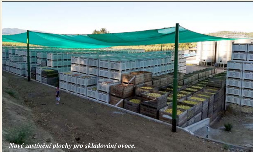
Nové zastínění plochy pro skladování ovoce.

V roce 2017 fungovala naše chilská společnost pod společnou taktovkou L. Čula a M. Dévy a vytvořila dále uvedená hospodářská výsledky.